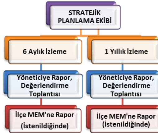
Şekil 2: Stratejik Plan İzleme ve Değerlendirme Modeli

Yukarıda sunulan Gölhisar Anadolu İmam Hatip Lisesi 2024-2028 yılı Stratejik Planı 59 ( ellidokuz) sayfadan ibaret olup tarafımızca incelenmiş ve imza altına alınmıştır.